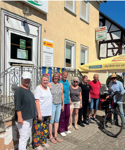
10 Jahre Dorfladen Miehlen